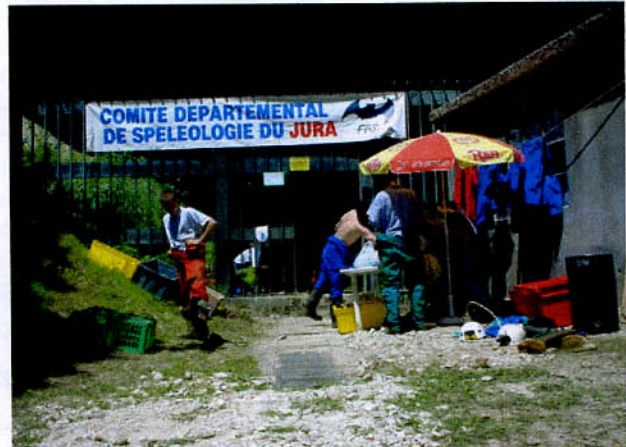
Grotte ouverte 2001 à la Caborne de Menouille.