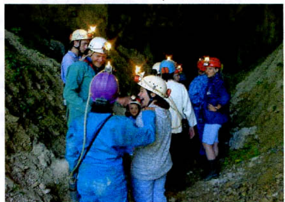
Grotte ouverte à la Caborne de Menouille