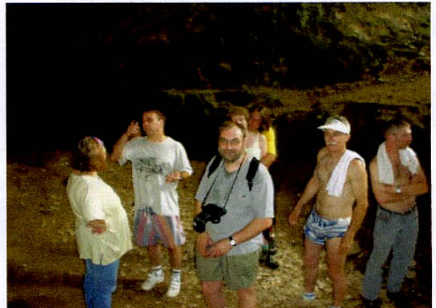
Sortie de la Caborne du Boeuf lors des 30 ans du SS).